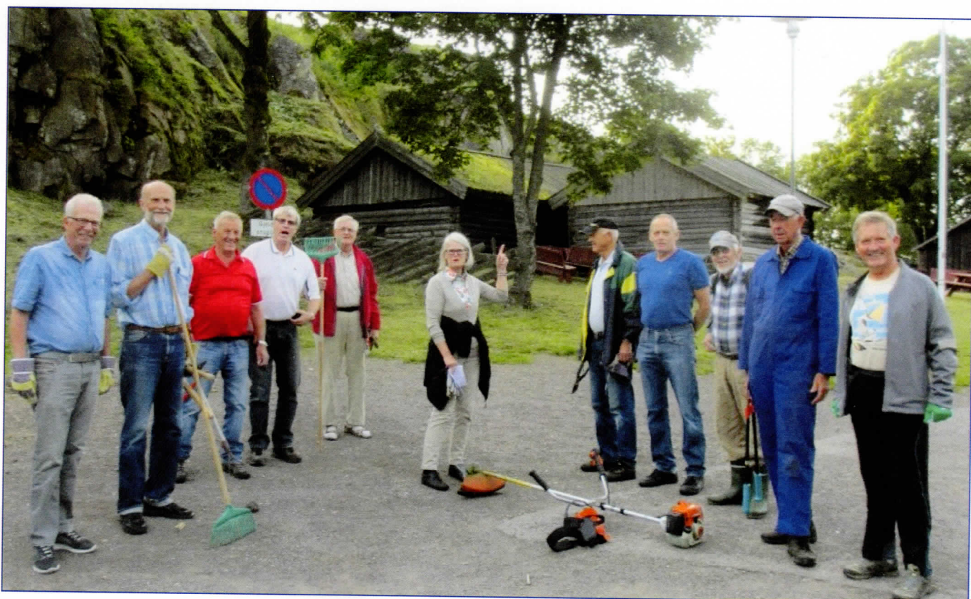
Dugnad på Slottsfjellet.