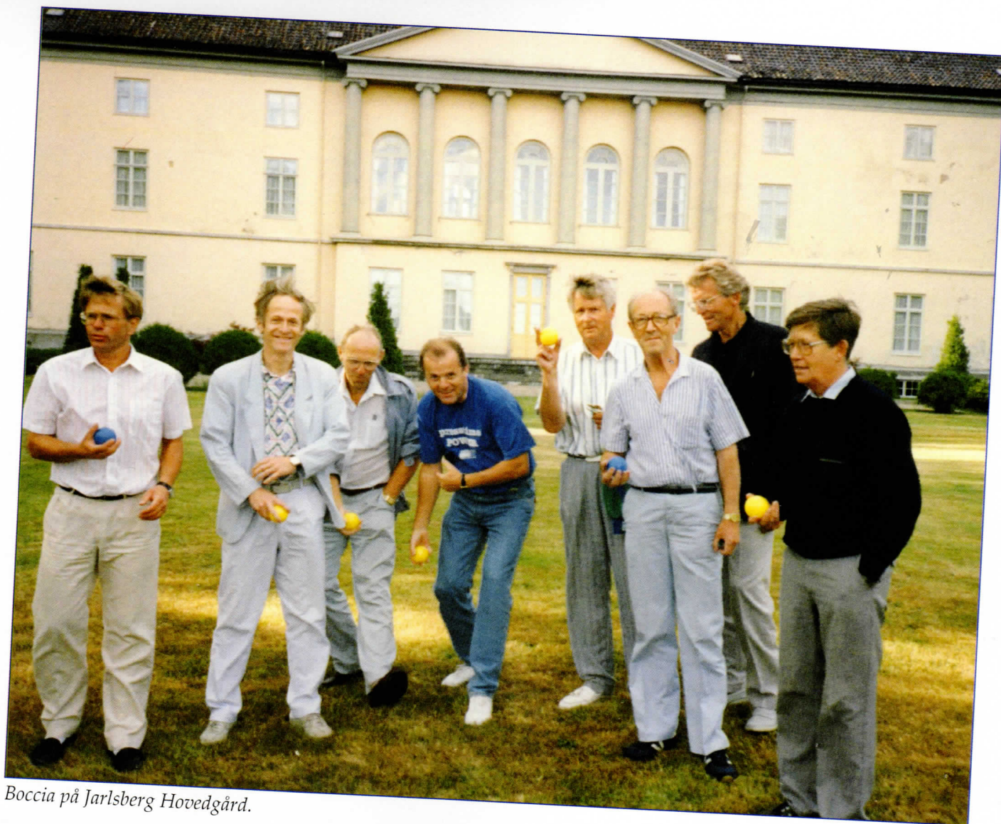
Boccia på Jarlsberg Hovedgård.