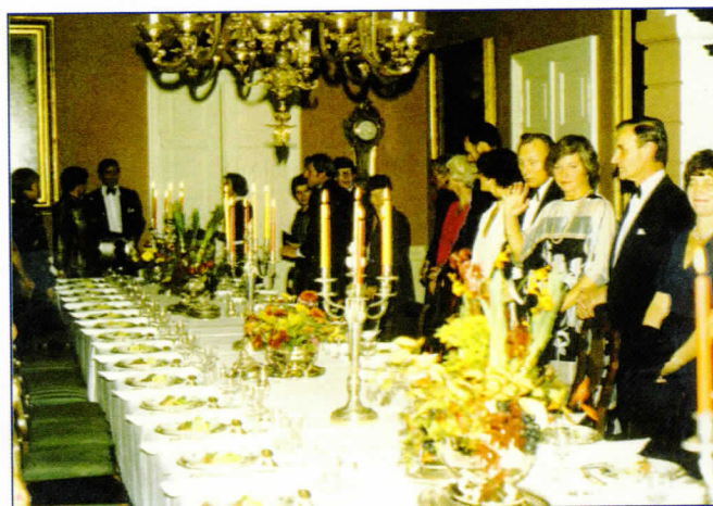
Jubileumsmiddag på Jarlsberg Hovedgård.