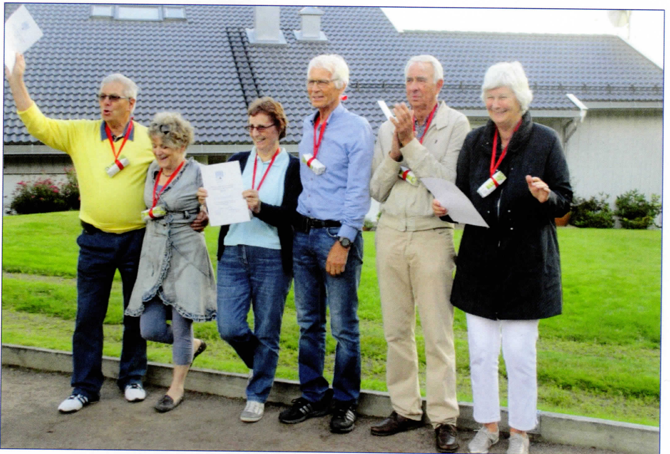
– og nå er damene også med.